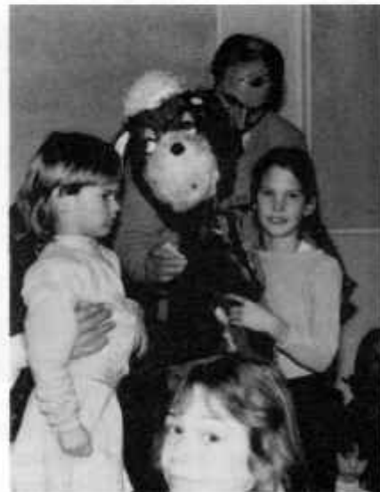
En lycklig vinnare.

Snättringe och Fullersta fastighets-ägareföreningars sedvanliga julfest arrangerades i Källbrinksskolan under Trettondagshelgen.