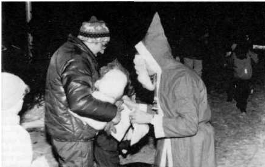
Tomten delar ut godispåsar.