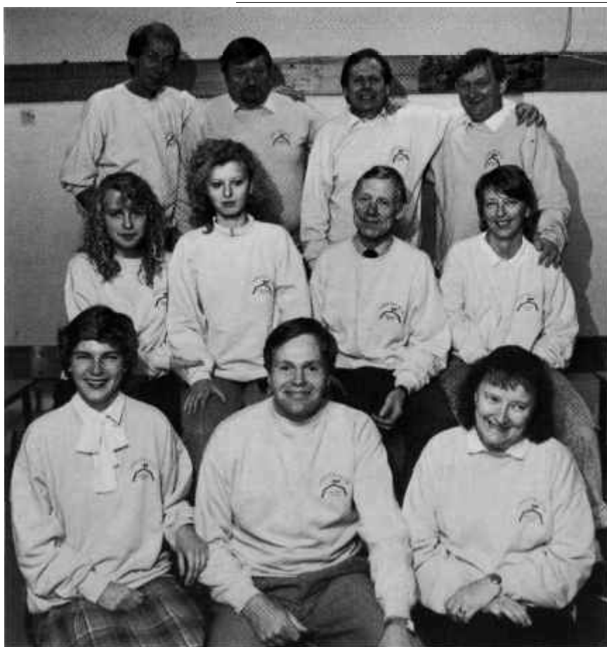
Några av föreningens aktiva medlemmar iklädda Snättringetröjor.