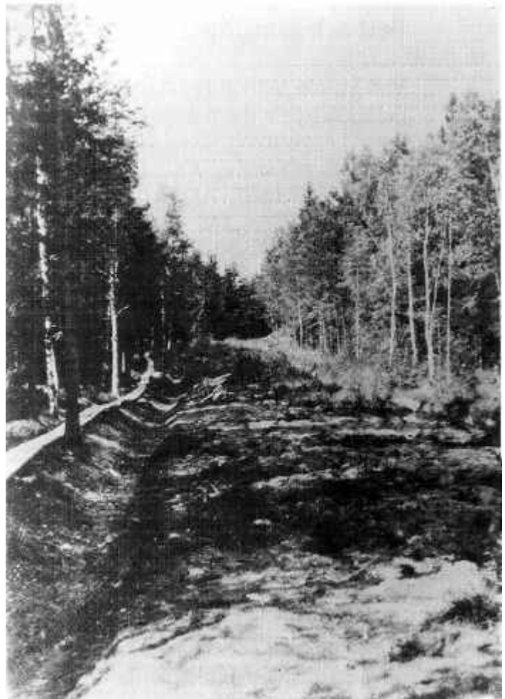
Så här såg Häradsvägen ut när nybyggarna kom

Barnen fick gå till Långbro för att gå i skolan. Långbro sjukhus hade mentalpatienter och många föräldrar var därför oroliga att sända iväg sina barn förbi sjukhuset. Snättringe skola invigdes 1930.