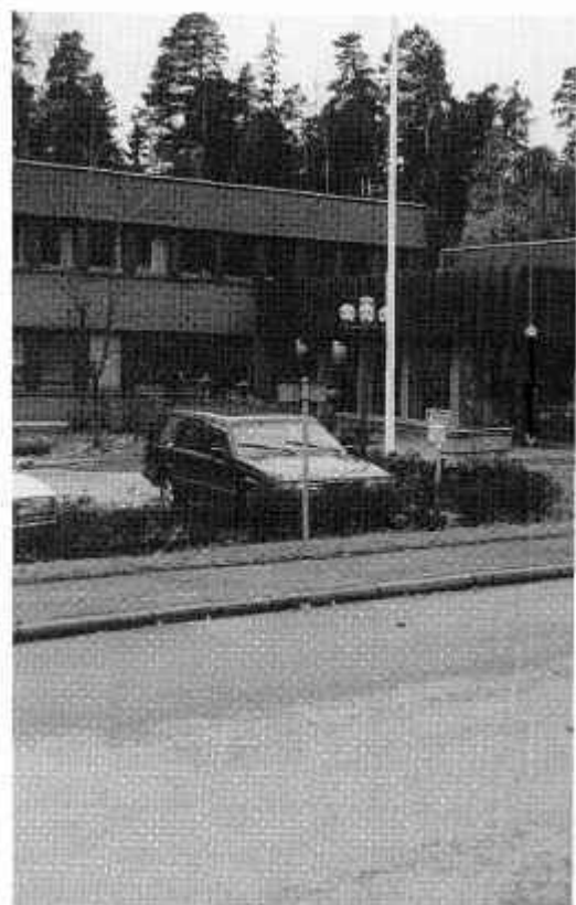
Larmet går! Markbrand i Länna.