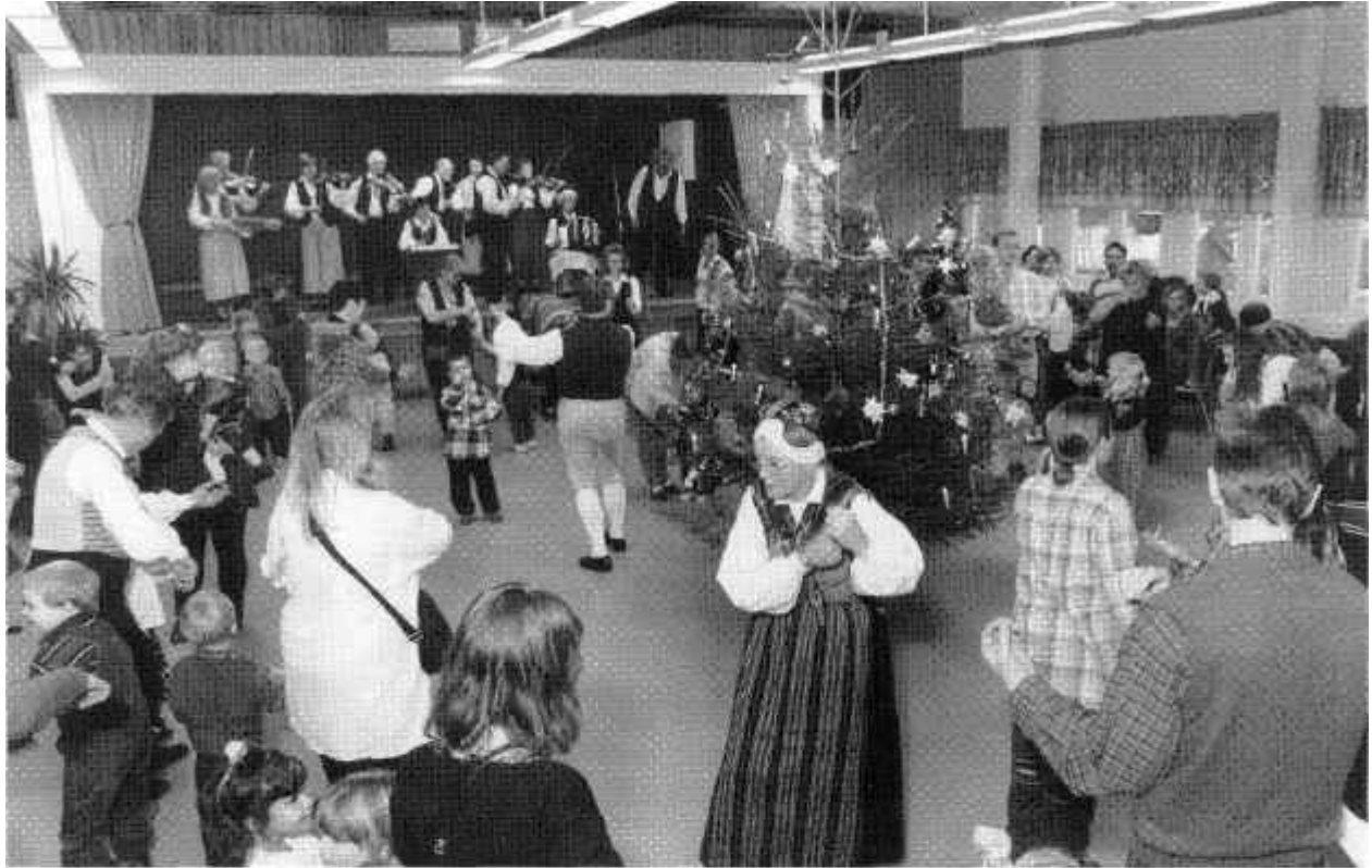
"Granen står så grön och grann i stugan....."- Slagsta Gille i högform