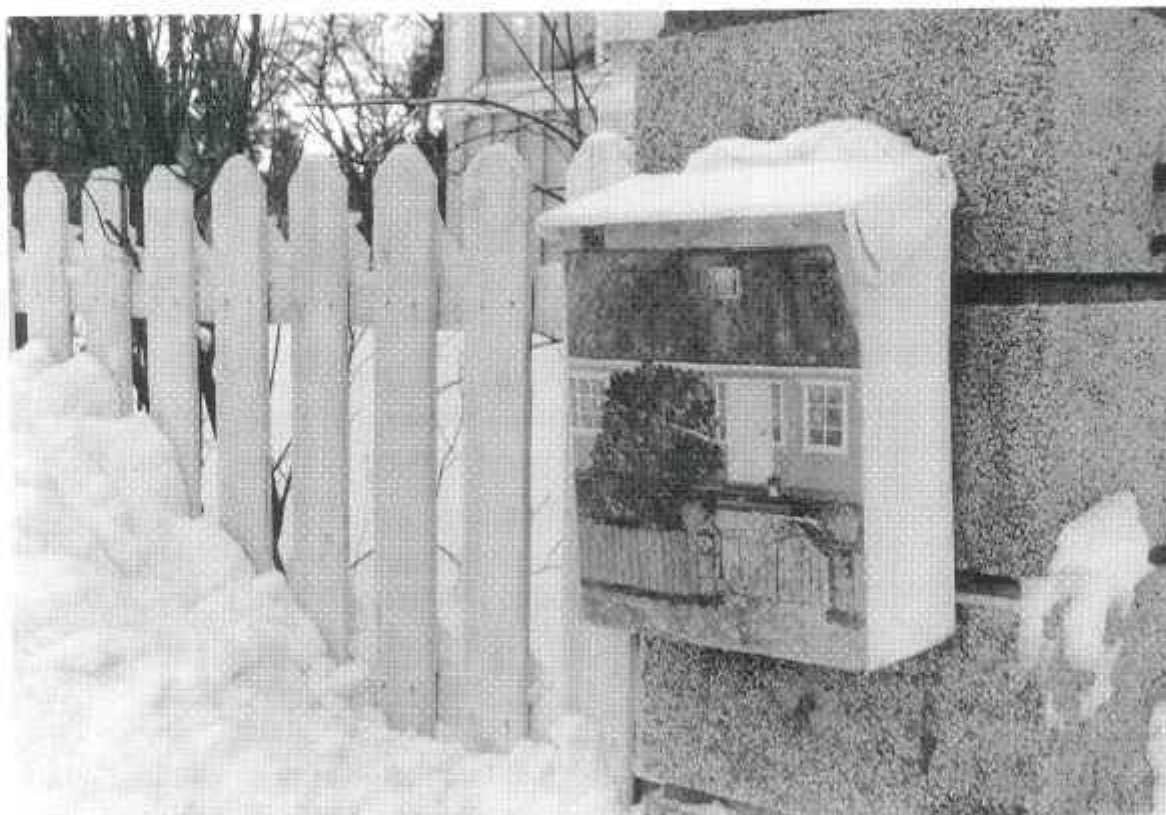
En av många vackra brevlådor i Snättringe

Medlemsinformation från Snättringe Fastighetsägareförening Nr 41 - Årgång 18 - Januari 1997