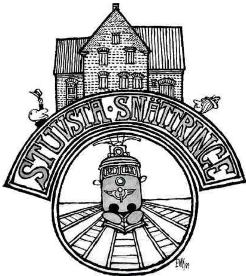
Kommundelslogotypen, ritad av EWK.

Runt om i Huddinge fanns det växthus, som värmdes med en nedsänkt ved/koleldad panna och varmvattenledningar i jorden. Ett låg vid Snättringe gård och där kunde man köpa blommor och till och med meloner. Några företagare blev stora och hade anställda som till exempel Preinitz verkstäder med som mest ett 80-tal anställda i Snättringe gårds gamla ekonomibyggnad. Vide-len vid Snättringeleden sydde barnkläder och hade ett 20-tal sömmerskor. I det huset är det numera förskola men Vide-lens gamla skylt sitter ännu på väggen, väl synlig från vägen.