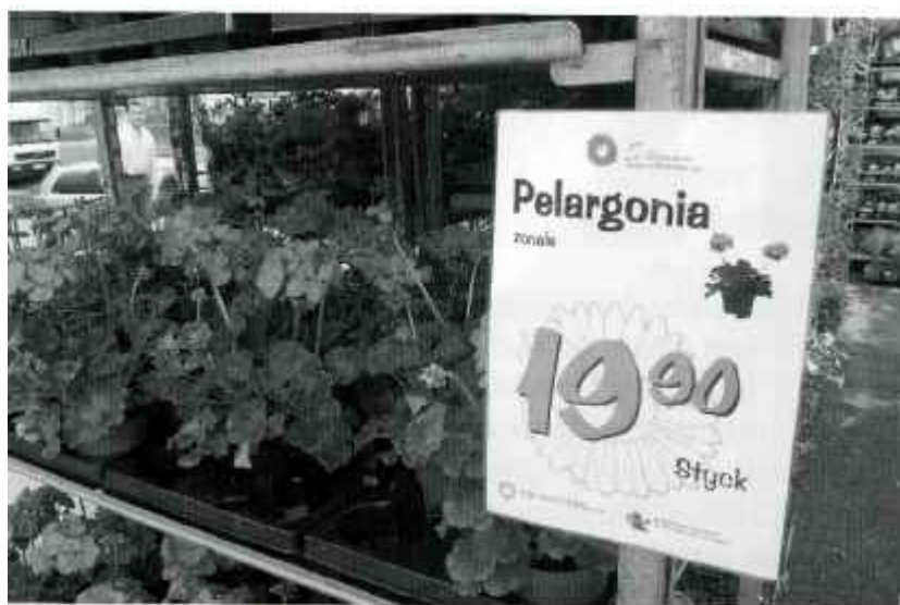
Pelargonier och andra sommarplantor prunkar utanför butiken.

Nu när sommaren snart är här så laddar Matbörsen