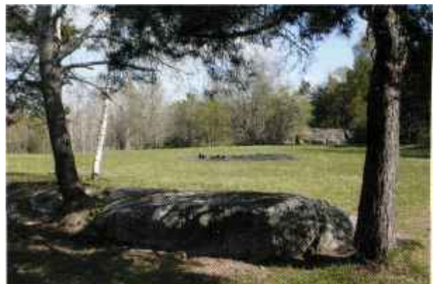
Gråberget sticker upp runt ängen.