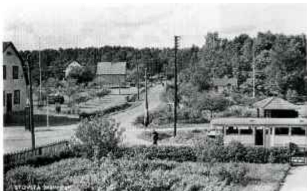
Hörnet Snättringevägen-Häradsvägen på 1930-talet. Till vänster Knallens livs med fotogenpump.

Det nya municipalsamhället behövde en möteslokal och man bildade föreningen Snättringe Samlingslokal, förkortat SSL. Man fick mark i backen mellan nuvarande Snättringevägen och flerbostadshusen vid Bergakungsvägen och medlemmarna byggde själva. Först gjordes en dansbana och där ordnades fester för att samla in pengar och 1932 byggdes Snättringe samlingslokal. Föreningen fick låna pengar av LO och huset användes sedan flitigt i 40 år. Det var fester, sammanträden med de olika föreningarna, vallokal, lekskola och senare även kommunal fritidsgård. Tyvärr brann huset ner dagen före nyårsafton 1972 på grund av överslag i de elektriska ledningarna.