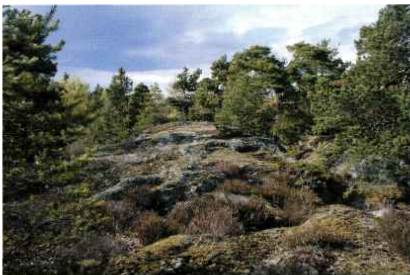
Hällparti på norra sidan av Kallkärrsklinten. Bergtet här består till stor del av granit eller pegmatit. Hällytan är oregelbunden och kantig jämfört med de slätare gnejshällarna.

Dessutom finns en del granit i berggrunden, uppsmält berg som stelnat djupt nere i jordskorpan och bildar oregelbundna klumpar av en stark, seg sten som ofta ser prickig ut eftersom de olika mineralen är jämnt spridda i stenen.