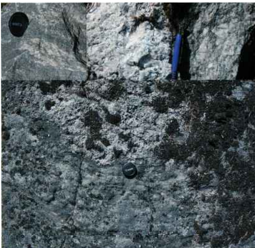
Bergarter på Kallkärrsklinten. Stora bilden: en hållyta med ljusare granit överst, mörkare gnejs nederst. Övre raden närbilder, från vänster: gnejs, granit, granit med stora kristaller av fältspat.

Vulkaner och jordbävningar härjade i miljontals år. Höga berg sköt upp och vittrade sönder. Krafterna fick jordskorpan att spricka i olika riktningar och