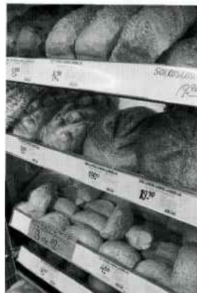
Färskt butiksbakat bröd lockar.