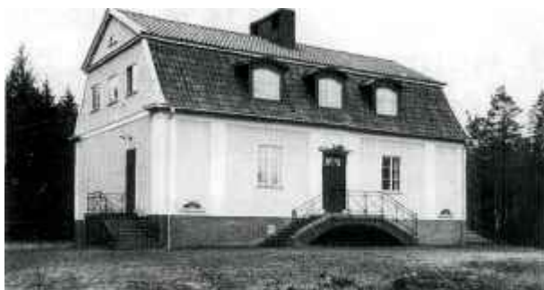
Snättringeskolan som nybyggd 1930. Här fanns två klassrum och en lärarbostad ovanpå.

1930 byggdes en skola i Snättringe. Det är det gula hus som fortfarande finns kvar vid Snättringeskolan. Det var två klassrum och lägenhet ovanpå till lärare. Skolan har sedan utökats i omgångar med flera byggnader och har nu en kringbyggd gård med en separat gymnastikbyggnad och för närvarande dessutom en paviljong på idrottsplatsen.