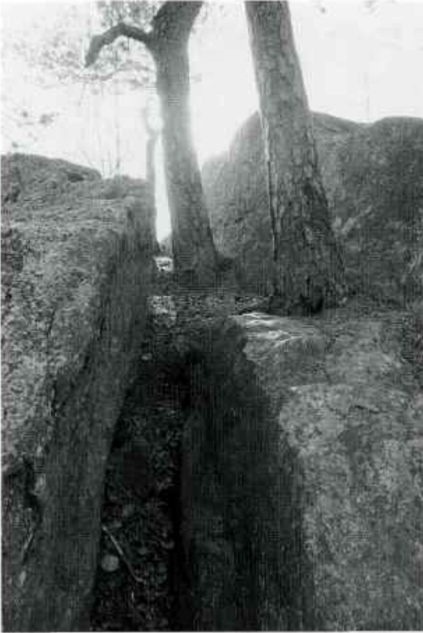
En klyfta i berget. Kanterna är släta. Kanske en utvittrad gång?