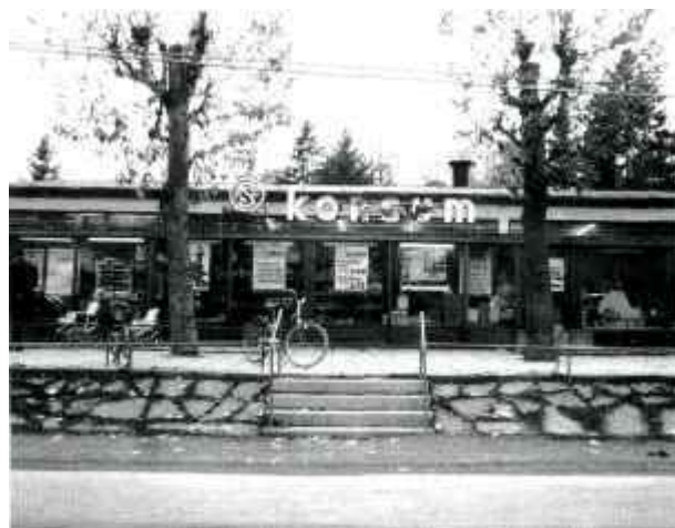
Snättringe Konsum med neonskylt.

och Jon Torparens väg. Snättringe livs (Vivstens affär) nuvarande "Annorlunda ting" vid Lönnvägen. Den flyttade senare ner till Snättringeleden och blev Vivo som nu har bytt namn till Vi. Vid Yrkesvägen fanns Pettersons livs. Konsum på Häradsvägen (nu pizzeria) öppnade 1943 och stängde 2002. Av de fem butikerna finns nu bara Vi kvar.