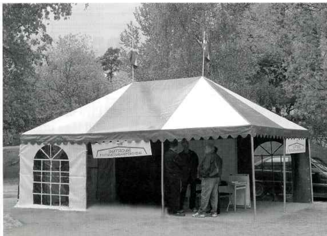
Föreningens tält under Långsjörundan 2004. Tältet är grönt och vitt som föreningens logga!

Här kan du också se om tältet och de andra grejorna är lediga!