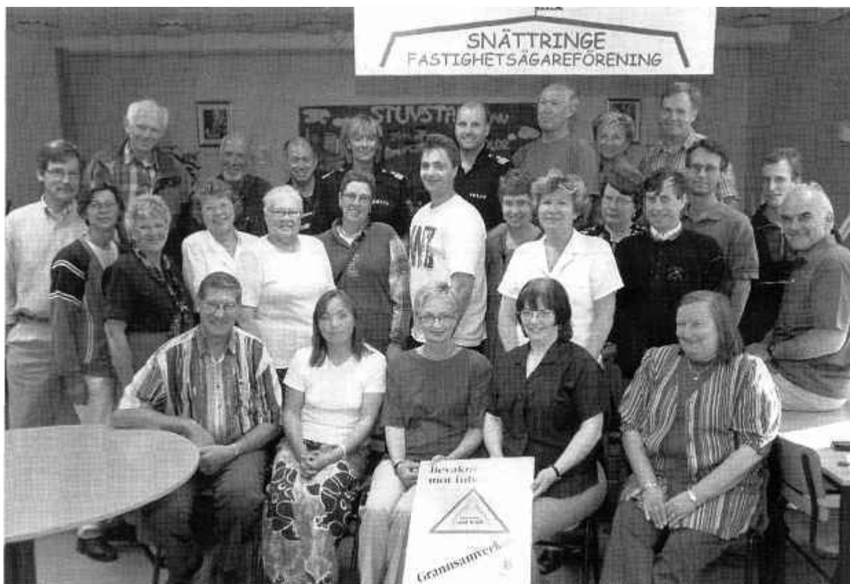
Några av alla i Snättringe som aktivt jobbar med grannsamverkan mot brott.