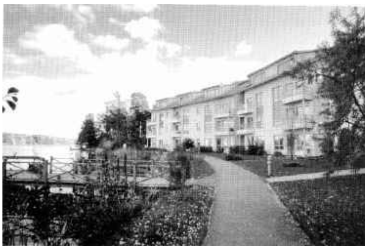
På sommaren finns det även möjlighet att ta en liten tur med roddbåt.