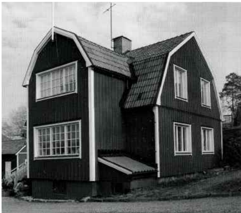
Se om ditt hus!

För att köpet skall slutföras så måste köparen undersöka huset. Det är där en husbesiktning kommer in i bilden.