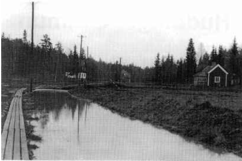
Så här såg det ut innan Häradsvägen byggdes