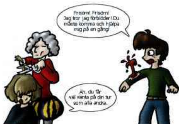
Teckning: Anna Östmark

Den sjunde mars 1894 bildades Frisörföreningen och arbetstiden för en frisöranställd var 68 timmar i veckan. Under stumfilmens tid på 20-talet började kvinnorna bli mer frigjorda och sökte sig ut i arbetslivet, ofta med kortklippt och ondulerat hår. Efter