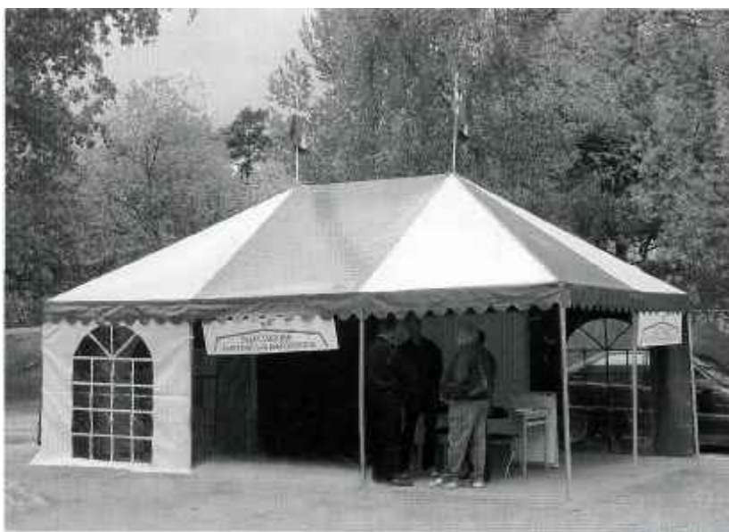
Tältet går i föreningens färger, grönt och vitt.