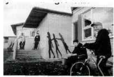
Ovan: Skuggor på väggen, Snättringeskolan