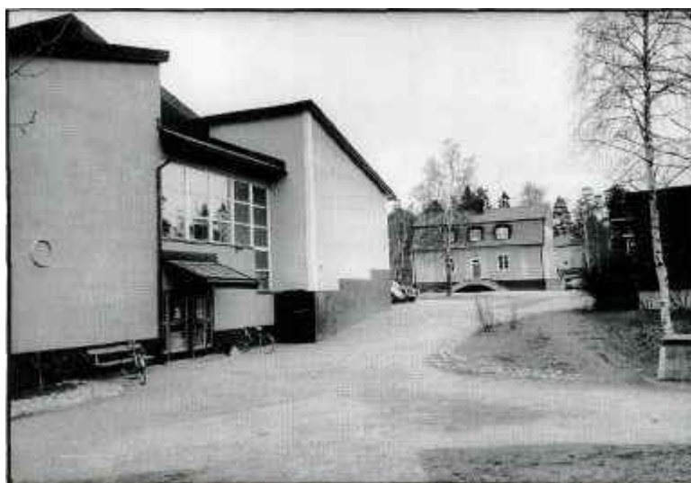
Snättringeskolan före sista tillbyggnaden

Uppe vid vattentornet vid slutet av Vattentornsvägen ordnar Stuvstakyrkan varje år