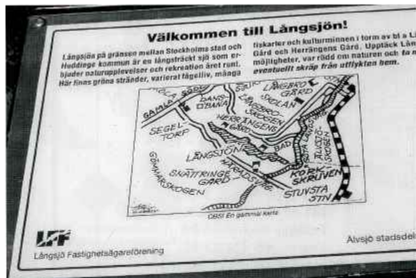
En av skyltarna längs Långsjön, illustrerad av Ingvar Thorén