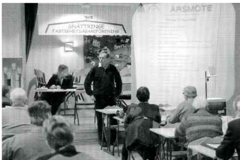
Årsmöte i Snättringe fastighetsägareförening den 22 februari 2006.