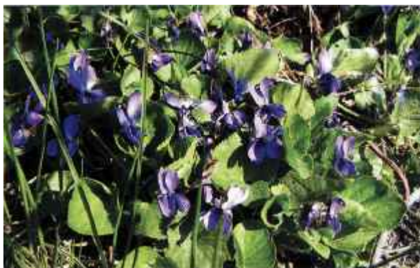
Luktviol, en skön trädgårdsrymling

Huddingefloran har utforskats en gång tidigare av kontorsskrivare Viktor Wimmerstedt som under 1920 och 30-talen studerade socknens flora. Då fanns det 676 arter. I dag har Ingemar noterat förekomsten av 1047 olika arter, varav 106 avser historiska uppgifter. Det betyder att inga fynd noterats senare än 1980. Några nya arter har hittats i samband med den aktuella inventeringen, bland annat coloradogran, fänrikshjärta,