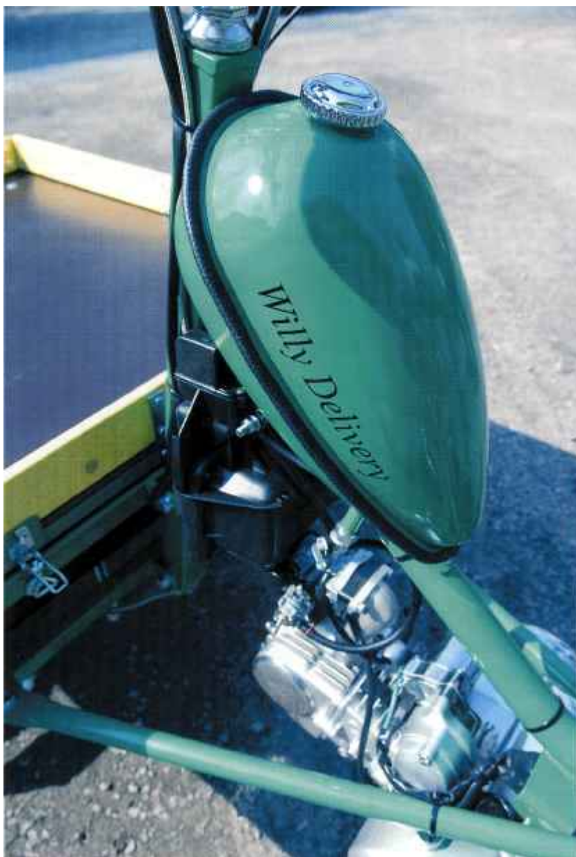
Willy Delivery Classic

Pappan startade verksamheten 1964 efter att ha varit servicechef på Monark.