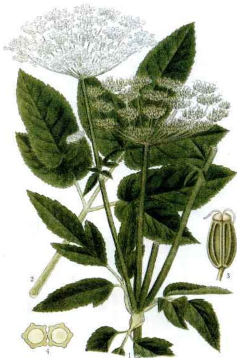
426. KIRSKÅL, AEGOPODIUM PODAGRARIA L.

Hatat ogräs eller nyttig köksväxt? Hur som helst så är kirskålen botaniskt intressant.