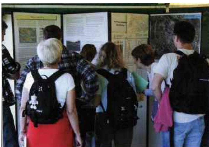
Många var intresserade av Snättringes historia.

Hos Snättringe Fastighetsägareförening kunde man få lite historiska kunskaper i tältet och en kopp kaffe medan den yngre generationen kastade boll och fick lite extra söndagsgodis.