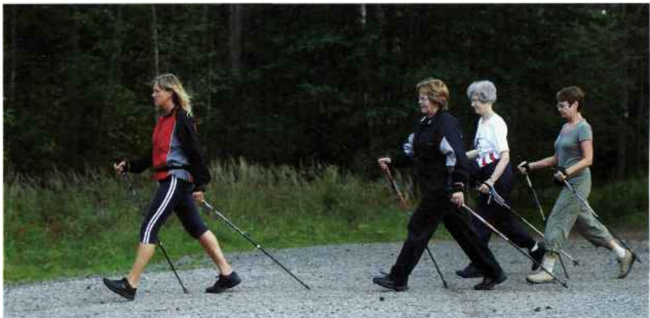
Stavgångare i farten.

Utöver ett par bra stavar krävs ingen speciell utrustning. Bra skor är dock viktigt som vid all motion. Det är inget fel att välja en kraftig sko som ger bra fäste i terrängen, joggingskor är också ett bra alternativ.