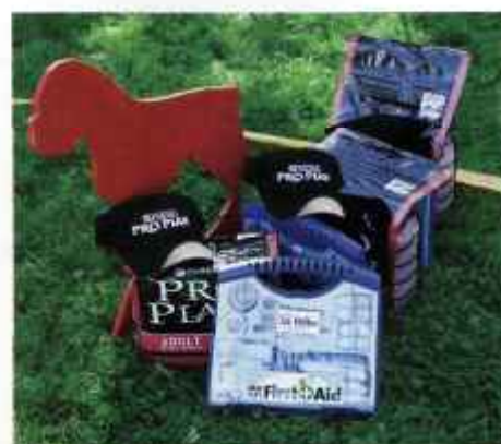
Fina priser från våra sponsorer.