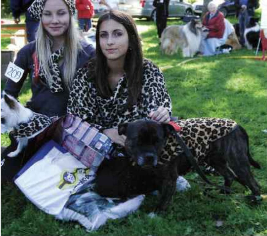
Leopardmönstrat är inne! Vinnare sådan matte/sådan hund.

Under årets Långsjörunda visade sig vädret från sin bästa sida. Söndagen den 10 september strålade solen från blå himmel och det var fullt med folk som promenerade runt sjön. Nio olika föreningar hade ställt upp med olika aktiviteter och en klurig fråga till tipspromenaden.