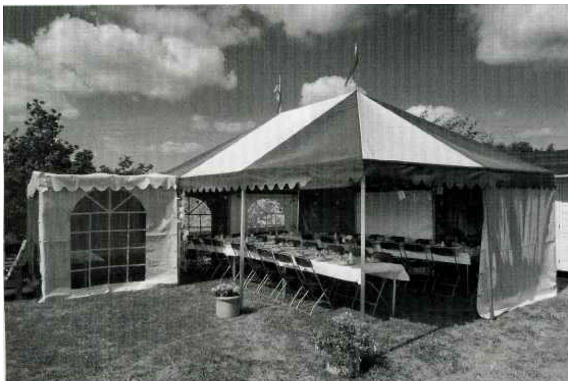
Partytältet i bröllopskrud