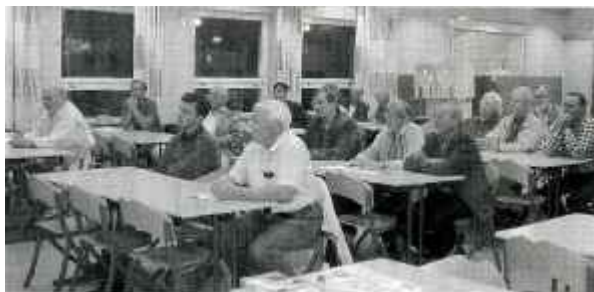
Publiken var stor och intresserad.

I en utfrågningsstund fick politikerna tre färgade lappar och skulle svara genom att räkna upp en lapp: grön stod för ja, röd för nej och gul vet ej. Ett intressant inslag när frågor om föräldraförsäkring, kommunalskatten och kommunikationer till och från Huddinge skulle besvaras.