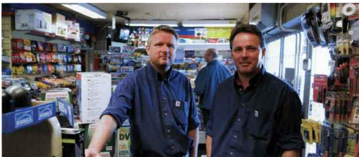
Bröderna Hultin driver OK/Q8-macken vid Huddingegymnasiet.

Biltvätten är populär - både den automatiska och den där man själv får gno med svamp och sämskskinn. De manuella hallarna präglas av lugn och ro där man för en billig penning kan tvätta i sin egen takt. Det finns ingen högtryckstvätt eller andra finesser men nog skiner pärlan i kapp med solen när man drar ner garagedörren och åker hem. För den som vill överlåta det smutsiga hantverket till maskiner så kan vi avslöja att en ny maskintvätt är på gång. Den kommer att monteras in under hösten för att så skonsamt som möjligt vara redo inför vinterns salt och slask.