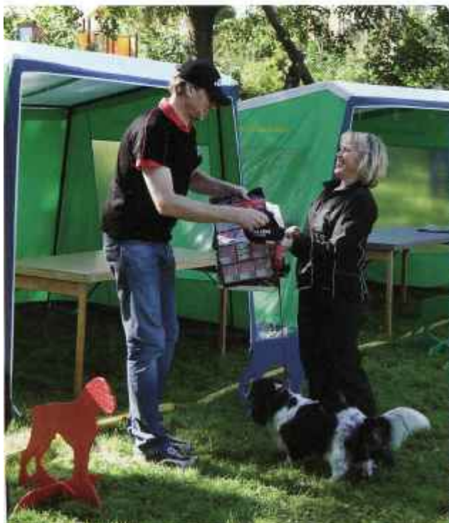
Selmas matte tar emot priset för tricksigaste hund.