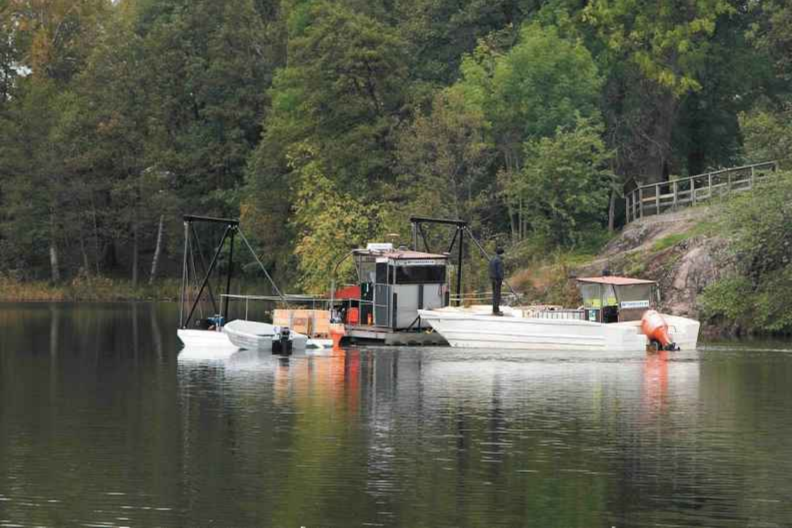
Båt med spridare och tendern, följebåten som matar spridarbåten med kemikalierna.