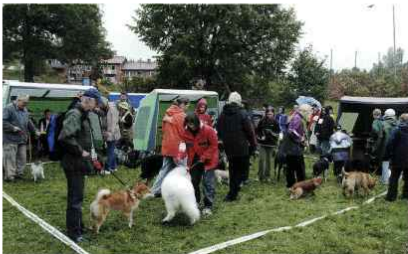
Många hundar och människor också hade vågat sig ut i blötan.

Årets Långsjörunda blev en blöt historia där vädrets makter inte var på vår sida. Det krävdes bra kläder och ett gott humör för att ta sig runt sjön. Några som glatt viftade på svansen var de närmare 30 hundar som ställde upp i tävlingen om Snättringes personligaste hund och Snättringes trixigaste hund. Många olika hundraser passerade revy, allt från en liten chihuahua till schäfer och labrador.