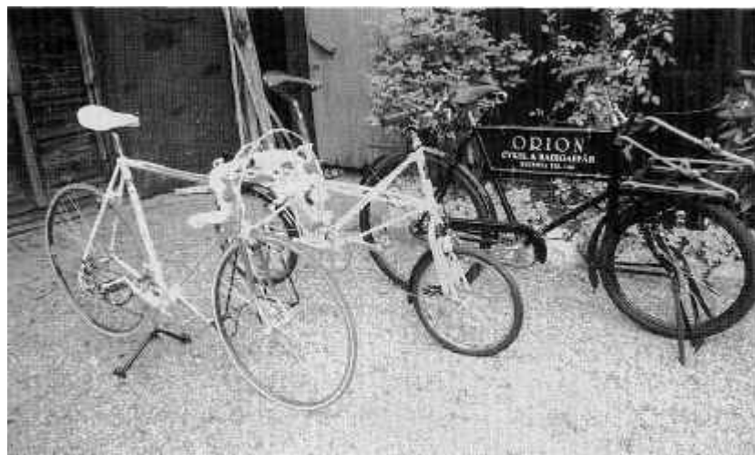
Alla cyklar är inte likadana!