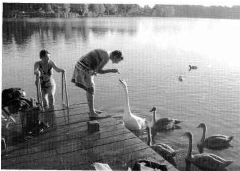
Familjen Svansson hälsar på.