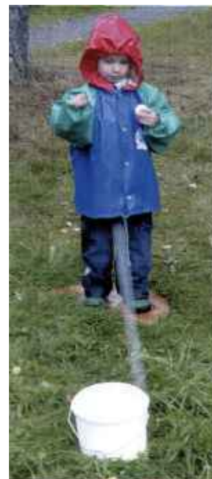
Bollkastning stod också på programmet.