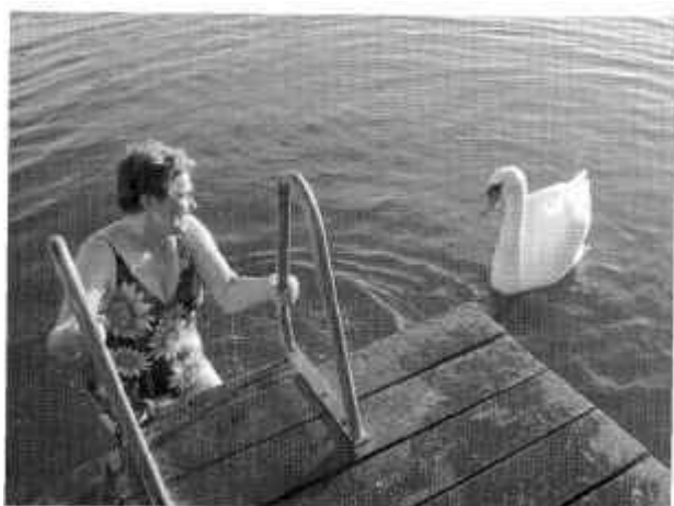
Möte vid morgondoppet.