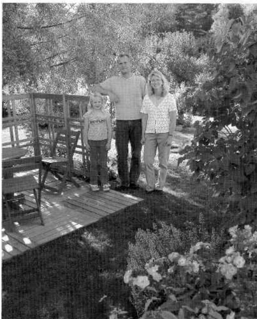
Familjen njuter av skuggan på den egenhändigt byggda uteplatsen.

Det ger en skön avkoppling efter arbetet att pyssla lite i trädgården, säger