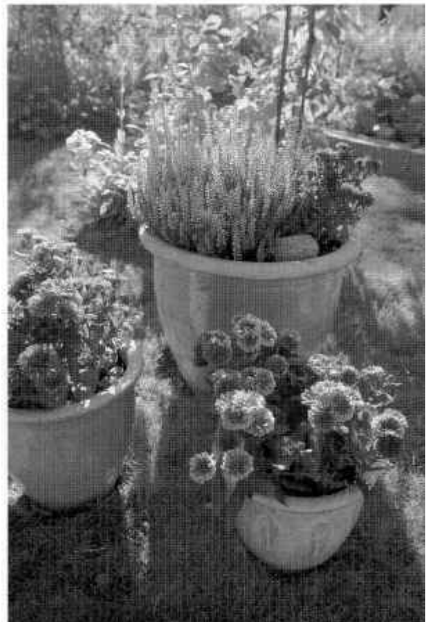
Visst längtar vi till nästa sommar!