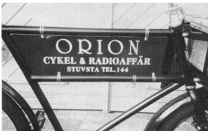
Budcykeln med Orions namn.

I slutet av 1930-talet bygg- fortsättning på nästa sida