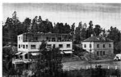
Gammalt vykort med Orionhuset.

Han hyrde den lokal där Orion ännu finns. Då låg den i gatuplanet, men idag uppfattas den som en källarlocal, vägen har höjts i omgångar.