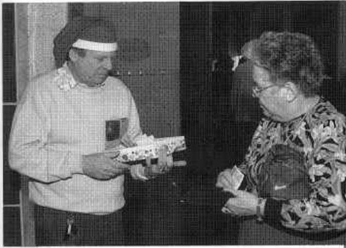
En påse av tomten när festen var slut