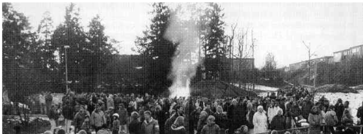
Valborgselden vid Utsälje värmdе många i vårkylan

Politikerna har därmed visat att de uppfattat problemen. Med något smärre tillägg borde förslaget vara acceptabelt för de flesta av oss. Vi bedömer också att Valborgstraditionen kan hållas vid liv.