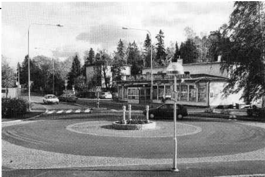
Den nya rondellen vid Stambanavägen

Ingen har väl undgått att se att antalet rondeller i Stuvsta har ökat. Snyggt stenlaggda trafikplatser där bilar och bussar kan samsas utan ljussignaler. Och fler rondeller är planerade.