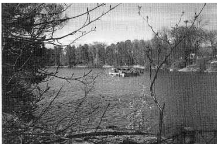
Trålfiske i Långsjön

Vi som bor runt Långsjön fick ett informationsblad om trålfiske omkring den 1 april i år. Första tanken var aprilskämt men det visade sig att det var ett nytt sätt att rena vattnet i Långsjön. Genom att ta bort beståndet av mörtfisk så ökar antalet djurplankton som i sin tur kan äta växtplankton vilket ger ett klarare vatten.