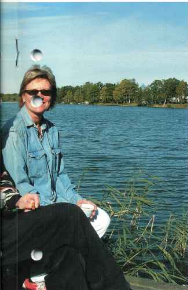
tt smaka föreningens kaffe vid kanten av Långsjön