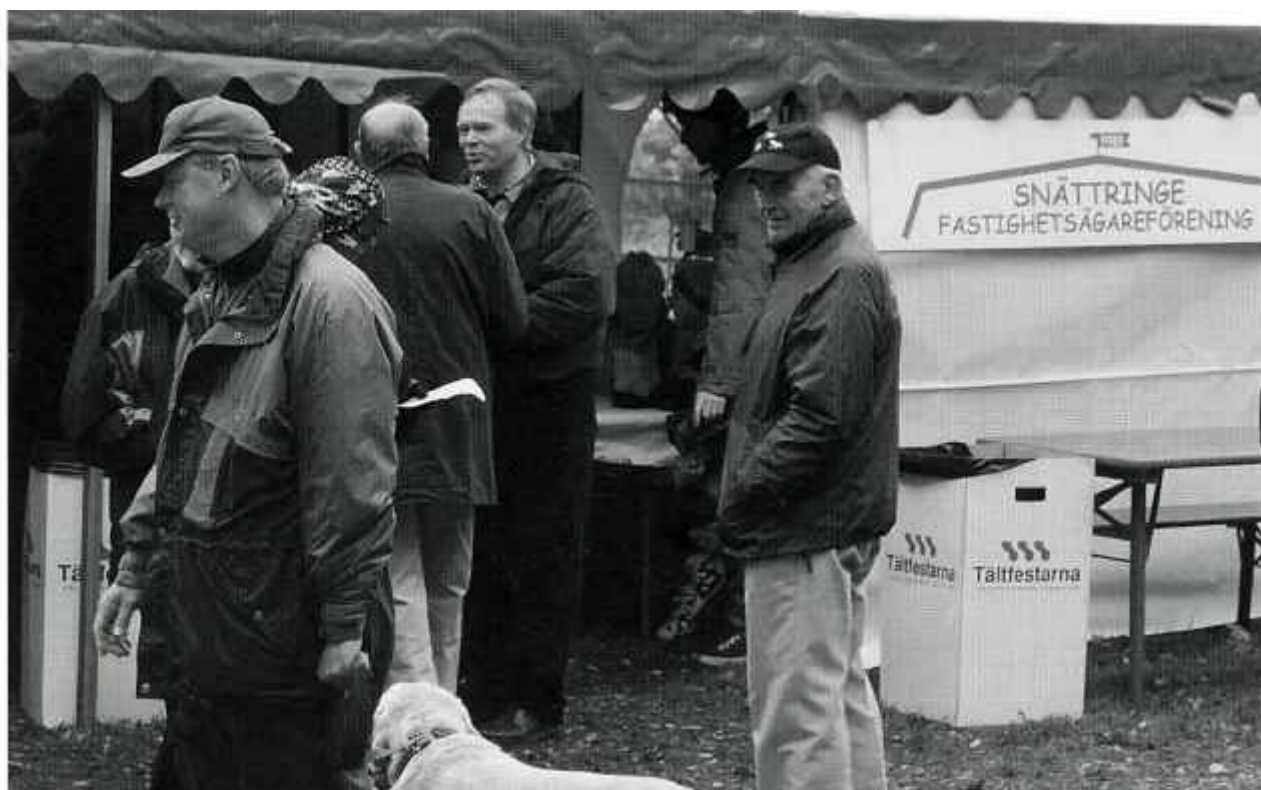
En chans att få lite kaffe och en kaka vid föreningens tält